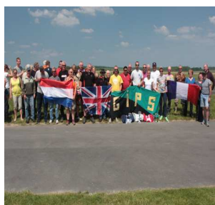
Bel exemple de communication s'il en est

1ere épreuve de l'E.P.A.C. (France) Millésime 2014