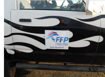
Les échos de la F.F.P

C'est dans une bien jolie région qu'ils se dérouleront (C'est la mienne, je suis Limousin !) Il faut espérer qu'il y fasse beau, sinon, même le Limousin...quand il pleut !!!! Difficile à dire à ce jour, combien il y aura de compétiteurs, quoiqu'il en soit, le meilleur gagnera...à être connu.