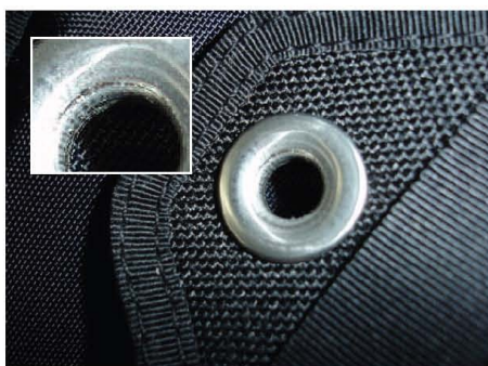
1. Oeillet abîmé

Vous pouvez voir les dommages à l'intérieur de l'oeillet