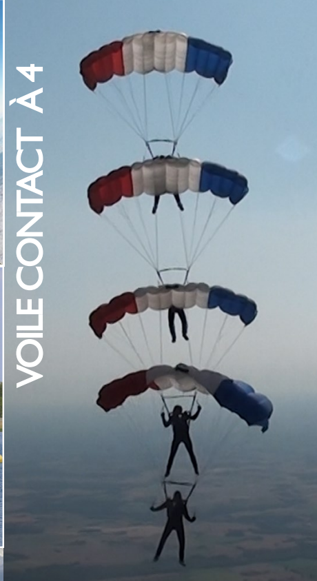
VOILE CONTACT À 4