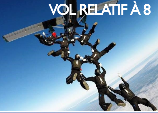
VOL RELATIF À 8