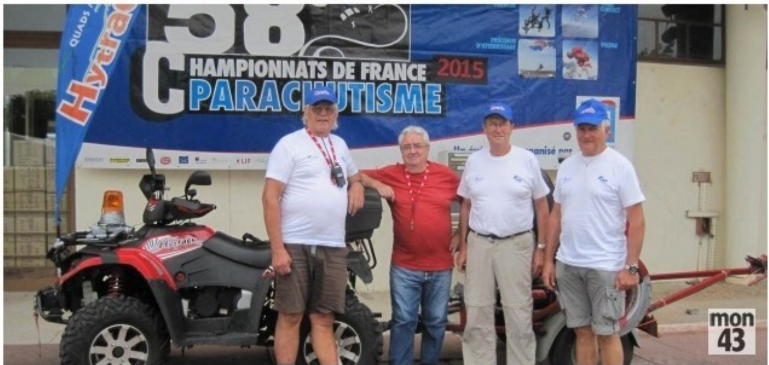
Le groupe du Puy.