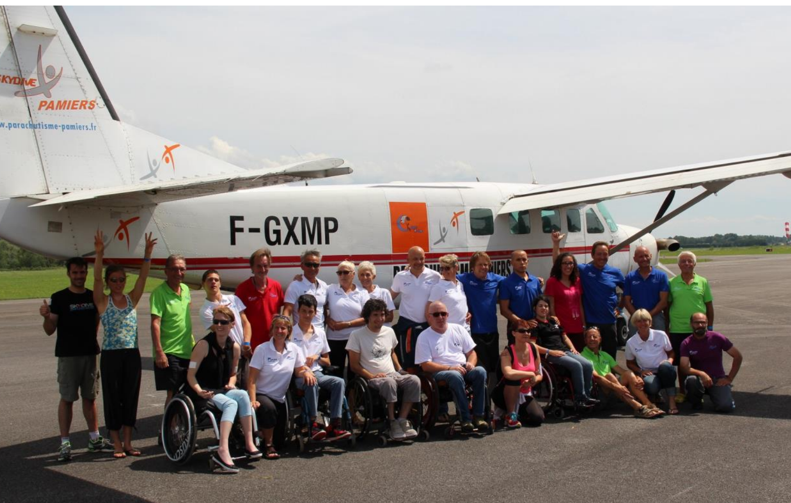
Le groupe de compétiteurs Handisport au Championnat de France Parahandisport à Vichy en 2014

En 2014, un championnat de France parahandisport a vu le jour, une initiative unique à l'échelle mondiale. Il se poursuit en 2015 et se déroule, à nouveau, en même temps que les championnats de France des personnes valides, preuve que la Fédération accorde une attention particulière aux parachutistes handisport.