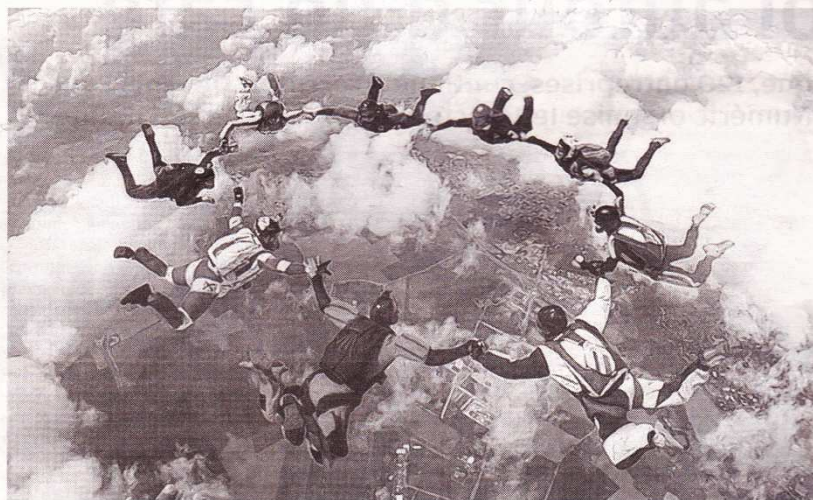
Le vol relatif, une des disciplines enseignée et pratiquée par le club niortais.

C'est un parachutiste militaire qui est à l'origine du Para-club niortais. Maurice Sauvé, figure de la vie politique niortaise à l'époque de René Gaillard, mais surtout héros du Débarquement - il était le septième Français à avoir été parachuté sur la Normandie dans la nuit du 5 au 6 juin 1944 - a transformé une amicale en club en 1954. Il en gardera la tête jusqu'en 1972, organisant notamment des spectacles à l'Olympia (les célèbres Tournées Baret) pour financer les sauts des pratiquants. Subsistance d'un certain esprit militaire, c'était aussi l'époque de « crapahuts » nocturnes, ouverts aux paras et aux autres clubs sportifs.