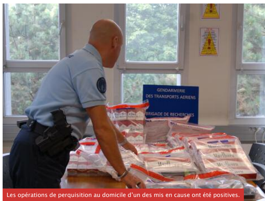
Les opérations de perquisition au domicile d'un des mis en cause ont été positives.

Texte: GND S. Vial