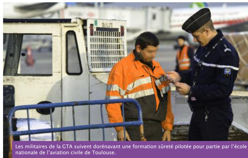
Les militaires de la GTA suivent dorénavant une formation sûreté pilotée pour partie par l'école nationale de l'aviation civile de Toulouse.

Cette formation plus complète et plus pratique a permis de porter la validité de ce stage à 6 ans au lieu de 3 avec l'ancien Surad. •••