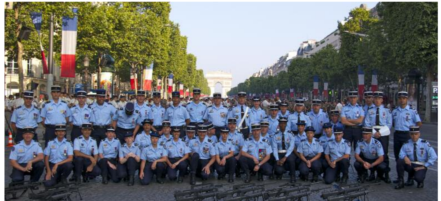
A quelques minutes du défilé, la photo souvenir.