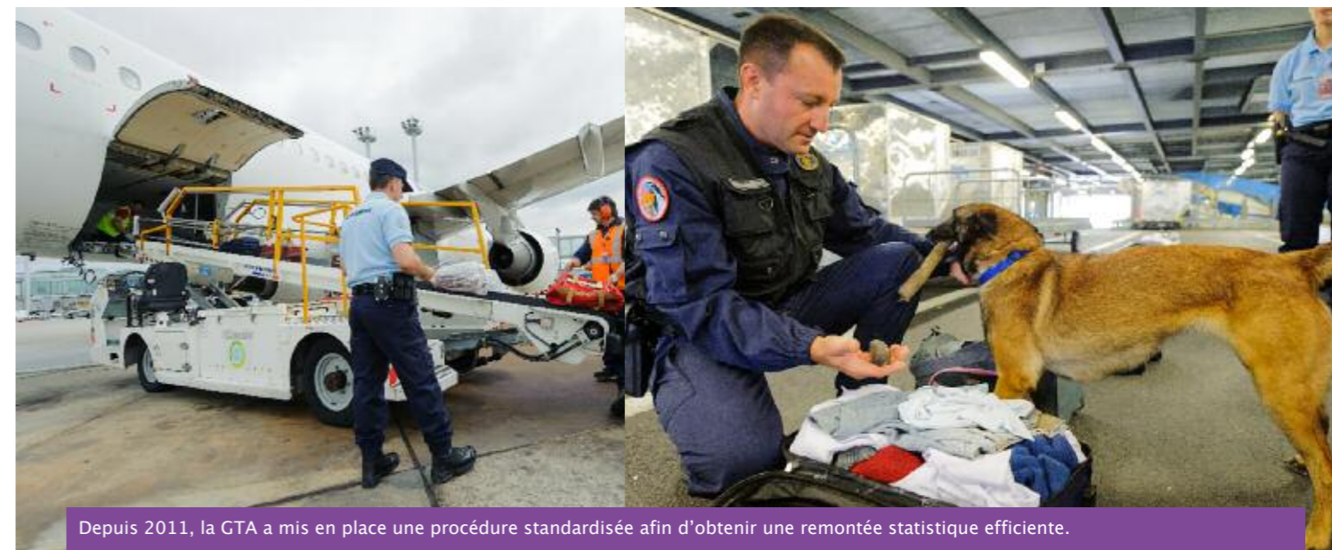
Depuis 2011, la GTA a mis en place une procédure standardisée afin d'obtenir une remontée statistique efficiente.

••• Au-delà des économies réalisées tant en moyens qu'en immobilisation de personnels, cette avancée a un impact très positif pour les personnels destinés à servir outre-mer.