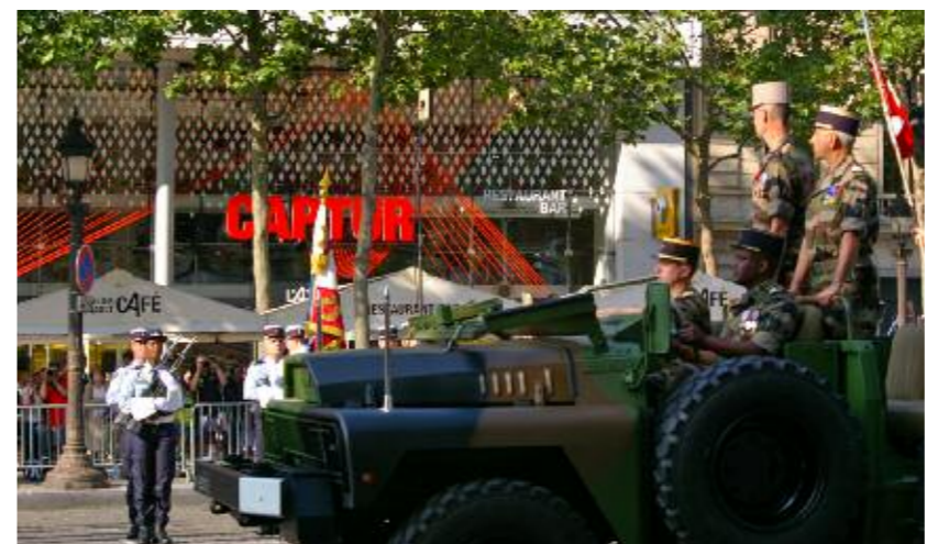
Passage en revue des troupes par le général Bazin en charge du défilé à pied.