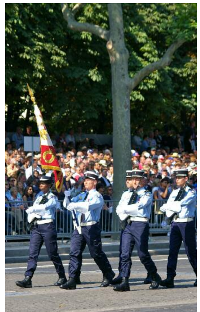
Grande première : le drapeau de la GTA sur les Champs-Élysées.