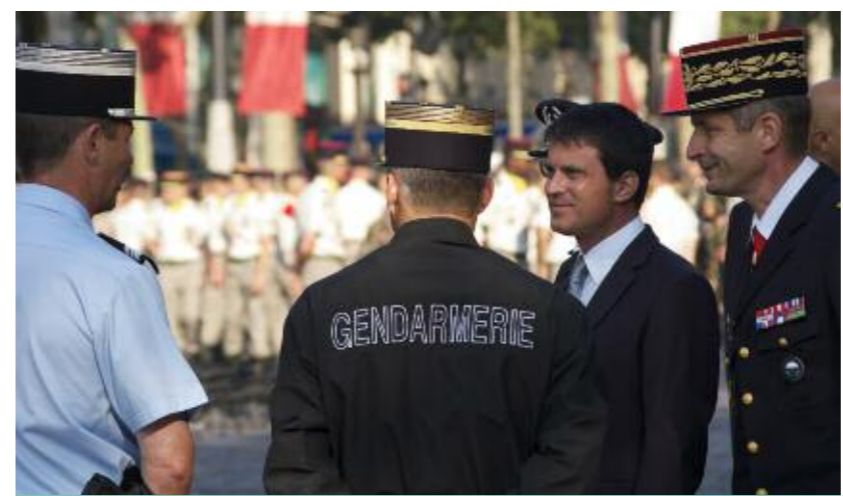
Le ministre de l'Intérieur et le directeur général de la gendarmerie nationale ont salué l'ensemble des troupes avant le défilé.

▼ DOSSIER LES FORMATIONS AU SEIN DE LA GTA