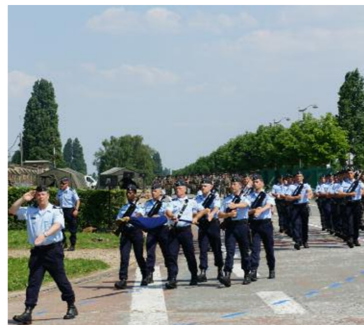
Après de nombreuses sessions d'entraînement, les militaires de la GTA ont défilé sur les Champs-Elysées.

Dimanche 14 juillet 2013, 40 militaires issus de toutes les unités de la GTA implantées en métropole ont défilé sur les Champs-Elysées aux côtés de 40 gendarmes mobiles de Maisons-Alfort.