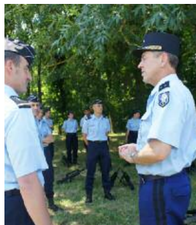
par le général Damien Striebig