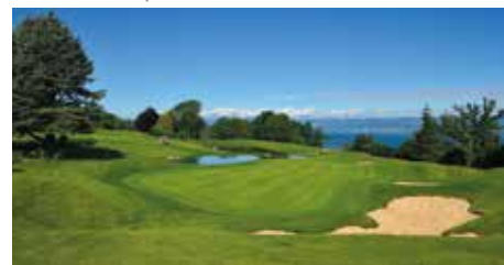
Le trou n°5 après les travaux

Le trou signature de ce parcours rénové sera le nouveau N° 5. Ce par 4 à l'aveugle devient un par 3 avec un green en île et un obstacle d'eau de 100 mètres de long à franchir de volée.