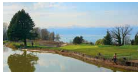
Le trou n°5 pendant les travaux