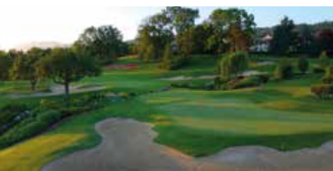
Le trou n°18 avant les travaux

L'Evian Puzzle désigne le nouveau cœur du parcours, l'enchaînement crucial des 15, 16, 17 et 18 où tout va se jouer ! Cette zone, située devant la terrasse du Club House, offre la possibilité exceptionnelle de créer encore plus de proximité entre les championnes et les spectateurs. Les tribunes métalliques laissent place à des modelés naturels offrant des points de vue uniques sur le jeu, tout en maintenant la dimension dramatique du final.