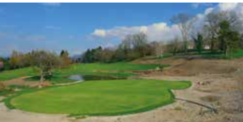
Le trou n°18 pendant les travaux