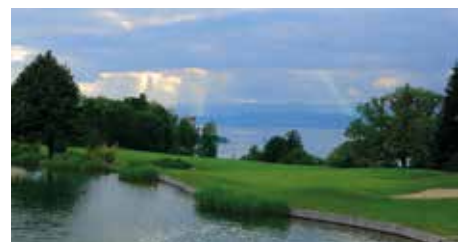
Le trou n°5 avant les travaux