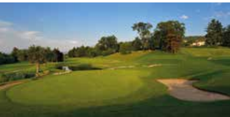
Le trou n°18 après les travaux