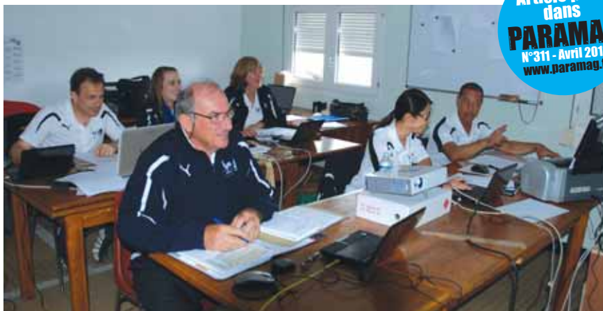
Les juges ont le sourire, mais leur travail consiste aussi à rester enfermés durant de longues heures (ou à cuire sous le soleil pour la PA I). Photo prise durant la coupe de France des disciplines artistiques à Lens, en 2012.

Il est paradoxal de constater que ces derniers ne formulent aucune critique lors des événements internationaux, alors que les mêmes portent souvent un jugement négatif sur nos performances lors des compétitions nationales. Nous réfléchissons à modifier notre image. Cela passe essentiellement par une formation continue, adaptée, mais aussi par une volonté indéfectible des juges à se remettre en question afin d'améliorer nos jugements.