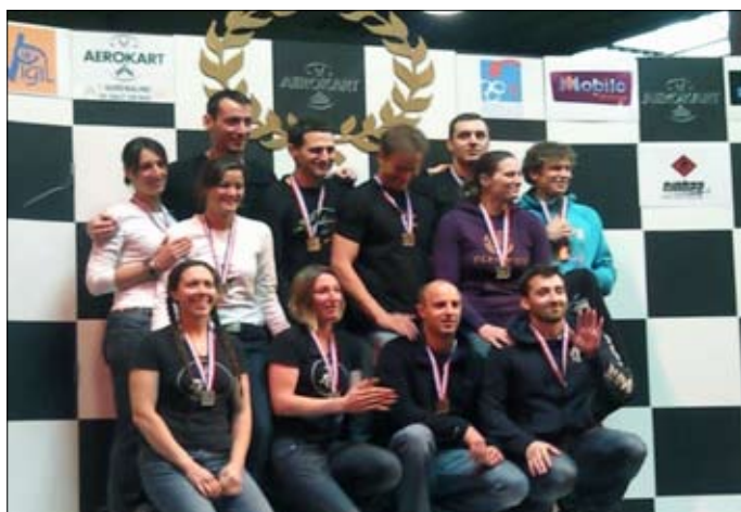
Podium N1 du Championnat de France Indoor

Première compétition nationale, la seconde édition du championnat de France de Vol Relatif indoor s'est déroulée dans la soufflerie AEROKART d'Argenteuil, en région parisienne.