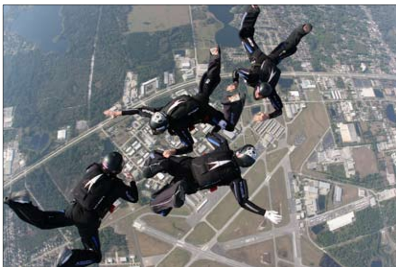
Equipe de France VR4 masculine au Shamrock de Floride

Classement open pour nos équipes : 2è pour l'équipe de France masculine Aérodyne Aérokart et 7è pour l'équipe de France féminine Deep Blue Defenders.