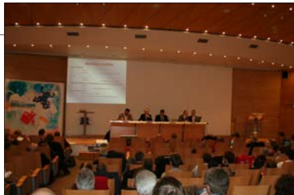
Ouverture de l'AG de la FFP, le 19 mars 2011

Elle informe que s'agissant d'une assemblée ordinaire, aucune condition de quorum n'est requise.