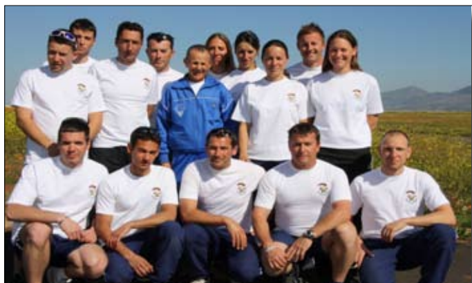
L'équipe PAV en stage au Maroc

Depuis quelques années déjà, l'équipe PAV démarre la saison au Maroc. Au programme de ce stage foncier, gros volume de sauts en Précision d'Atterrissage et en Voltige.