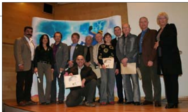
Récompenses aux bénévoles de la FFP