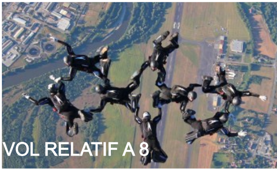
VOL RELATIF A 8