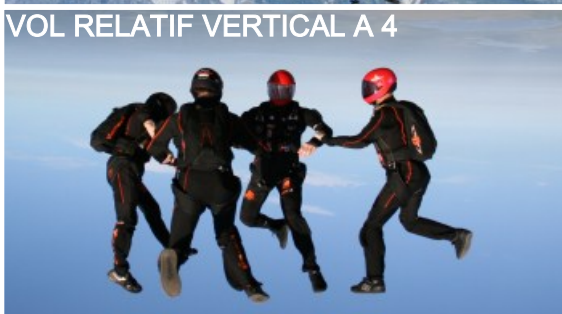
VOL RELATIF VERTICAL A 4