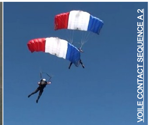
VOILE CONTACT SEQUENCE A 2