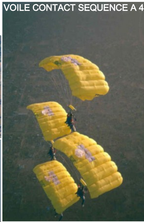
VOILE CONTACT SEQUENCE A 4