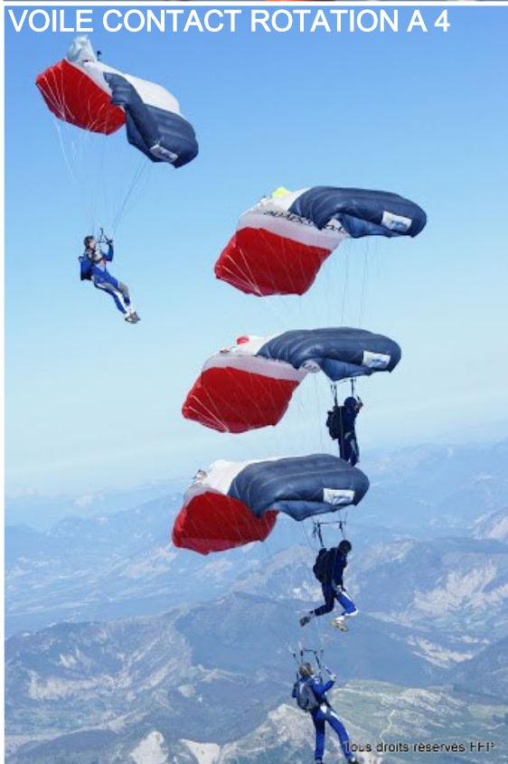
VOILE CONTACT ROTATION A 4